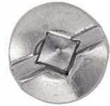
TETE CYLINDRIQUE EMPREINTE CARREE FENDUE