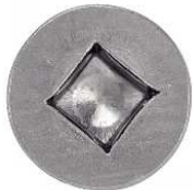
TETE FRAISEE CARREE