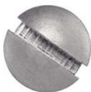
TETE FRAISEE BOMBEE FENDUE