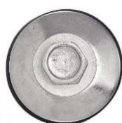
TETE HEXAGONALE A AILETTES POINTE 3 AVEC RONDELLE EPDM