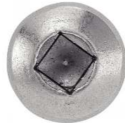
TETE CYLINDRIQUE EMPREINTE CARREE