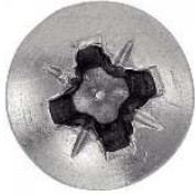
TETE FRAISEE BOMBEE POZIDRIVE