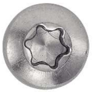
TETE CYLINDRIQUE SIX LOBES