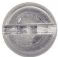
TETE CYLINDRIQUE FENDUE