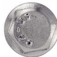
TETE HEXAGONALE A EMBASE