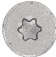
TETE FRAISEE CRANTEE SIX LOBES