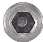
TETE CYLINDRIQUE SIX PANS CREUX