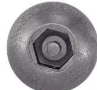
TETE BOMBEE SIX PANS CREUX INVIOLEABLE AVEC TETON CENTRAL