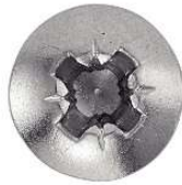
TETE CYLINDRIQUE POZIDRIVE