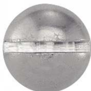
TETE RONDE FENDUE