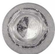
TETE HEXAGONALE AVEC RONDELLE Ø 16