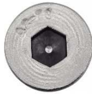
TETE CYLINDRIQUE REDUITE SIX PANS CREUX