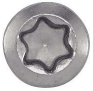
TETE FRAISEE BOMBEE SIX LOBES