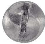
TETE CYLINDRIQUE INVOLABLE -ONE WAY-