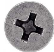
TETE FRAISEE PHILLIPS