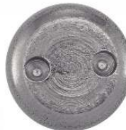
TETE CYLINDRIQUE INVIOLEABLE -SNAKE EYES-