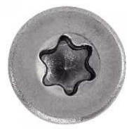
TETE FRAISEE SIX LOBES