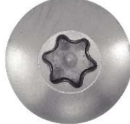
TETE CYLINDRIQUE LARGE SIX LOBES POUR PENTURES