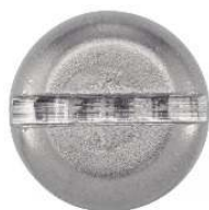
TETE CYLINDRIQUE LARGE FENDUE