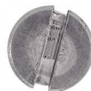
TETE FRAISEE FENDUE