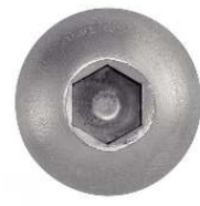
TETE BOMBEE SIX PANS CREUX