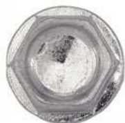
TETE HEXAGONALE A EMBASE CRANTEE