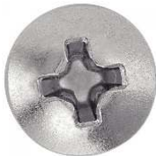
TETE CYLINDRIQUE PHILLIPS