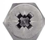
TETE HEXAGONALE POZIDRIVE AVEC BOUT PILOTE