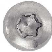
TETE CYLINDRIQUE LARGE SIX LOBES