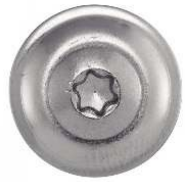
TETE FRAISEE BOMBEE SIX LOBES + RONDELLE EPDM Ø 15