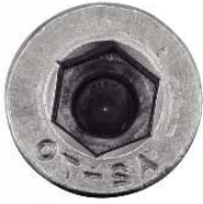
TETE CYLINDRIQUE REDUITE SIX PANS CREUX AVEC TROU DE GUIDAGE