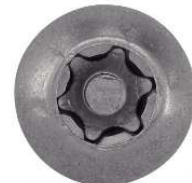
TETE BOMBEE SIX LOBES INVIOLEABLE AVEC TETON CENTRAL