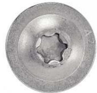
TETE PLATE LARGE SIX LOBES