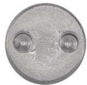
TETE FRAISEE INVIOLEABLE -SNAKE EYES-