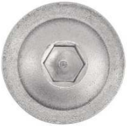
TETE BOMBEE SIX PANS CREUX A EMBASE