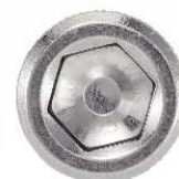
TETE CYLINDRIQUE SIX PANS CREUX -UNC-