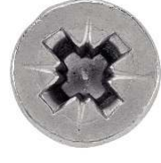
TETE FRAISEE POZIDRIVE