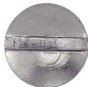
TETE FRAISEE BOMBEE FENDUE