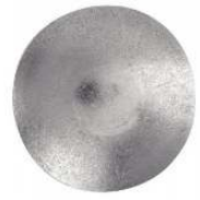
TETE RONDE COLLET CARRE