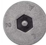
TETE FRAISEE SIX PANS CREUX INVIOLEABLE AVEC TETON CENTRAL