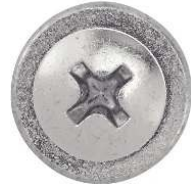
TETE CYLINDRIQUE CRANTEE EXTRA LARGE PHILLIPS