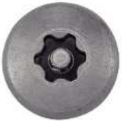
TETE CYLINDRIQUE LARGE SIX LOBES INVIOLEABLE AVEC TETON CENTRAL POUR PENTURES