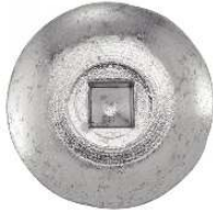
TETE CYLINDRIQUE CRANTEE EXTRA LARGE EMPREINTE CARREE