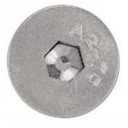
TETE FRAISEE SIX PANS CREUX