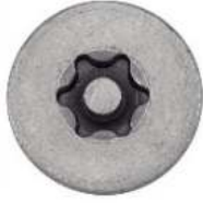
TETE FRAISEE SIX LOBES INVOLABLE AVEC TETON CENTRAL